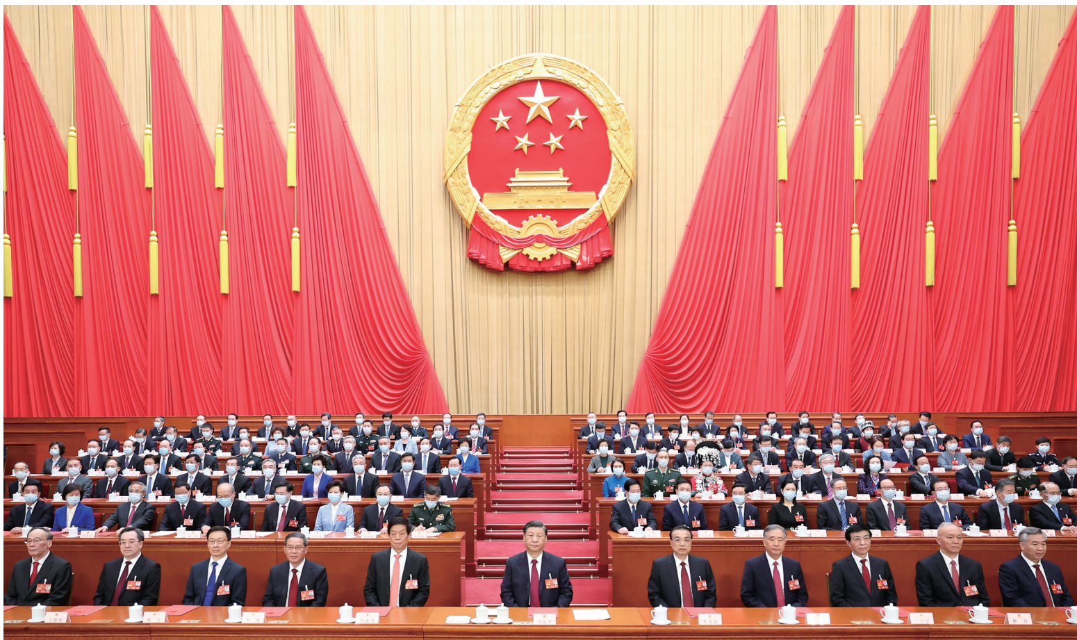
3月13日,第十四届全国人民代表大会第一次会议在北京人民大会堂闭幕。中共中央总书记、国家主席、中央军委主席习近平发表重要讲话。