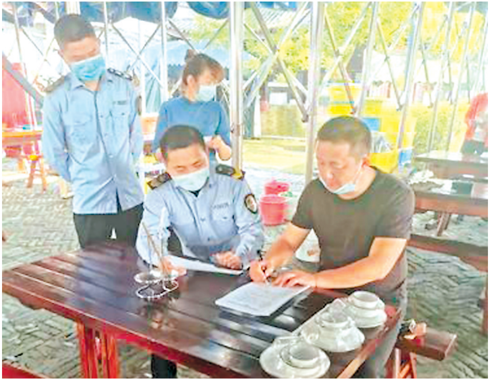
市场监管局工作人员深入餐饮店签订文明餐桌活动协议书

本报讯(殷勤 周洁)为最大限度防范和减少餐饮环节交叉感染及食源性疾病传播,切断“口口相传”的疾病传播途径,推进文明餐桌,深化我市全国文明城市建设,最近,市场监督管理局结合疫情防控和餐饮业复工复产情况,全力推进“公勺公筷”行动,邀你“筷”吃饭!