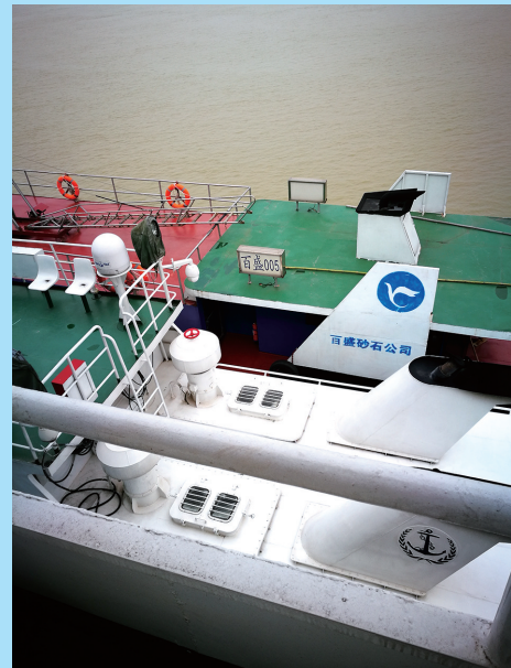
公司锚地过驳基地一角。