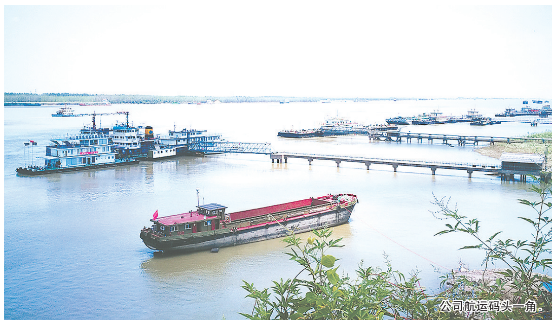
公司航运码头一角。