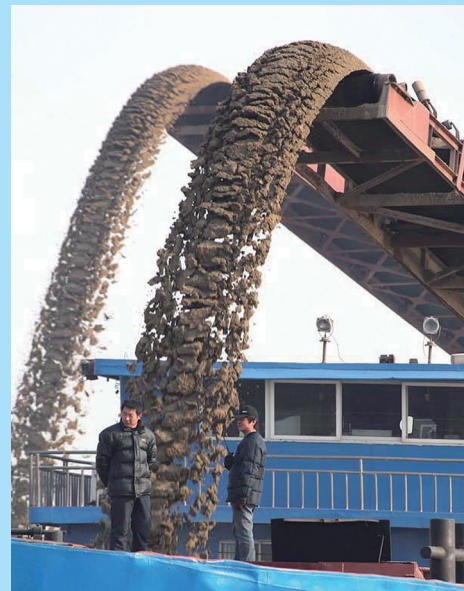
公司砂石航运作业。