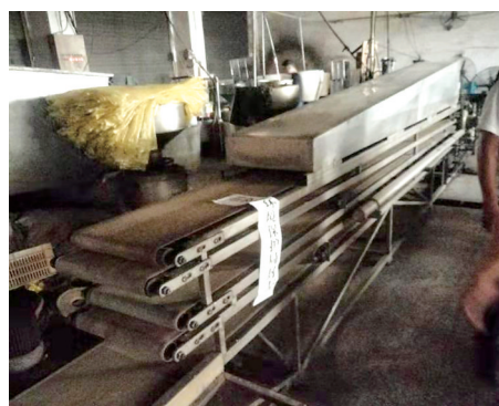
环保部门对黑作坊进行取缔查封。

收到市民热线工单后,市环卫中心第一时间对取水车作出整改,要求各生产单位根据实际情况调整取水车作业、取水时间和取水地点,坚决杜绝高峰拥堵期间占道取水现象继续发生,同时也强调了各生产单位要加强车辆安全教育,对生产车辆进行规范管理。