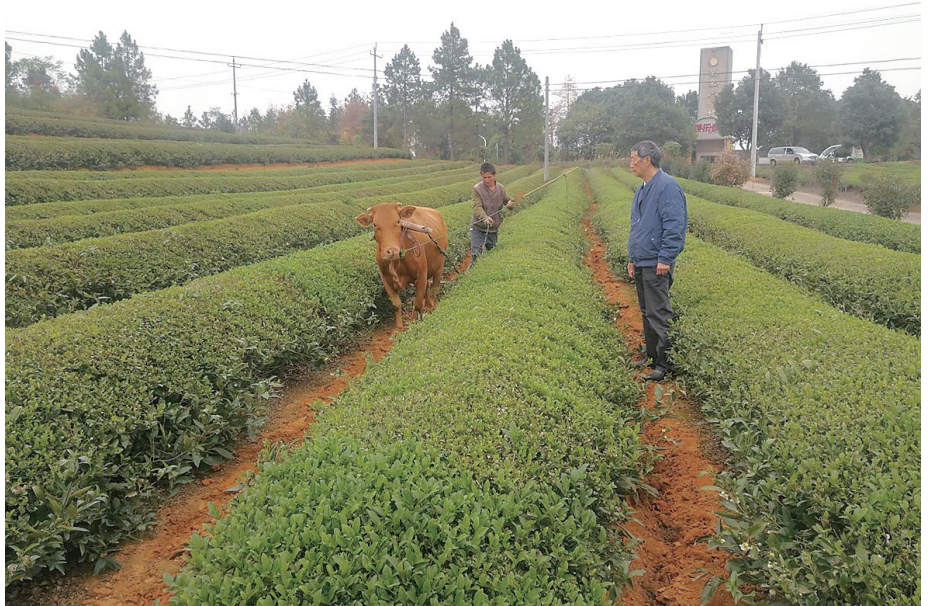
黄沙街洞庭春茶业运用耕牛开沟覆肥。

正值冬季茶园管护的关键时期,11月上旬以来,我市茶叶企业全力投入冬季茶园管理和茶叶加工设施改造,到处一派补种施肥的繁忙景象,掀起了冬季茶园管护热潮,为进一步扩大岳阳黄茶生产数实效,创实效。