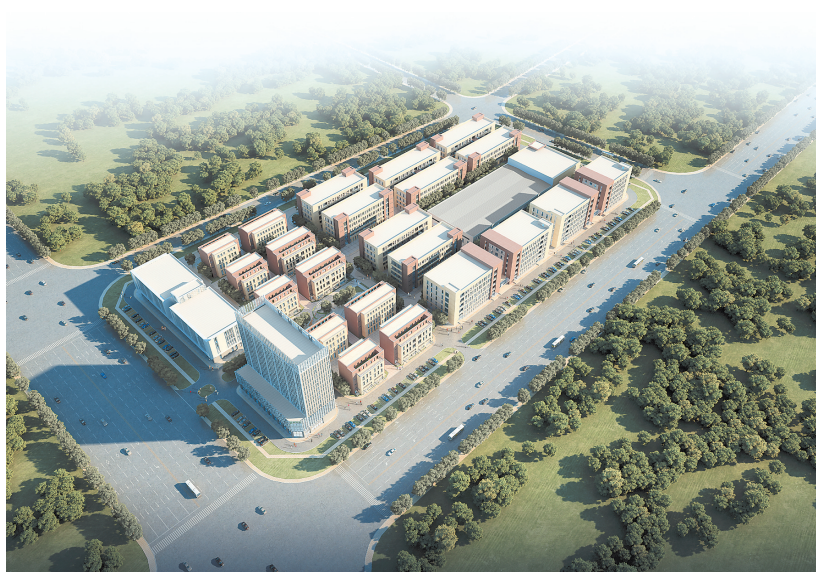
图为哈工大机器人(岳阳)创新中心项目效果图。