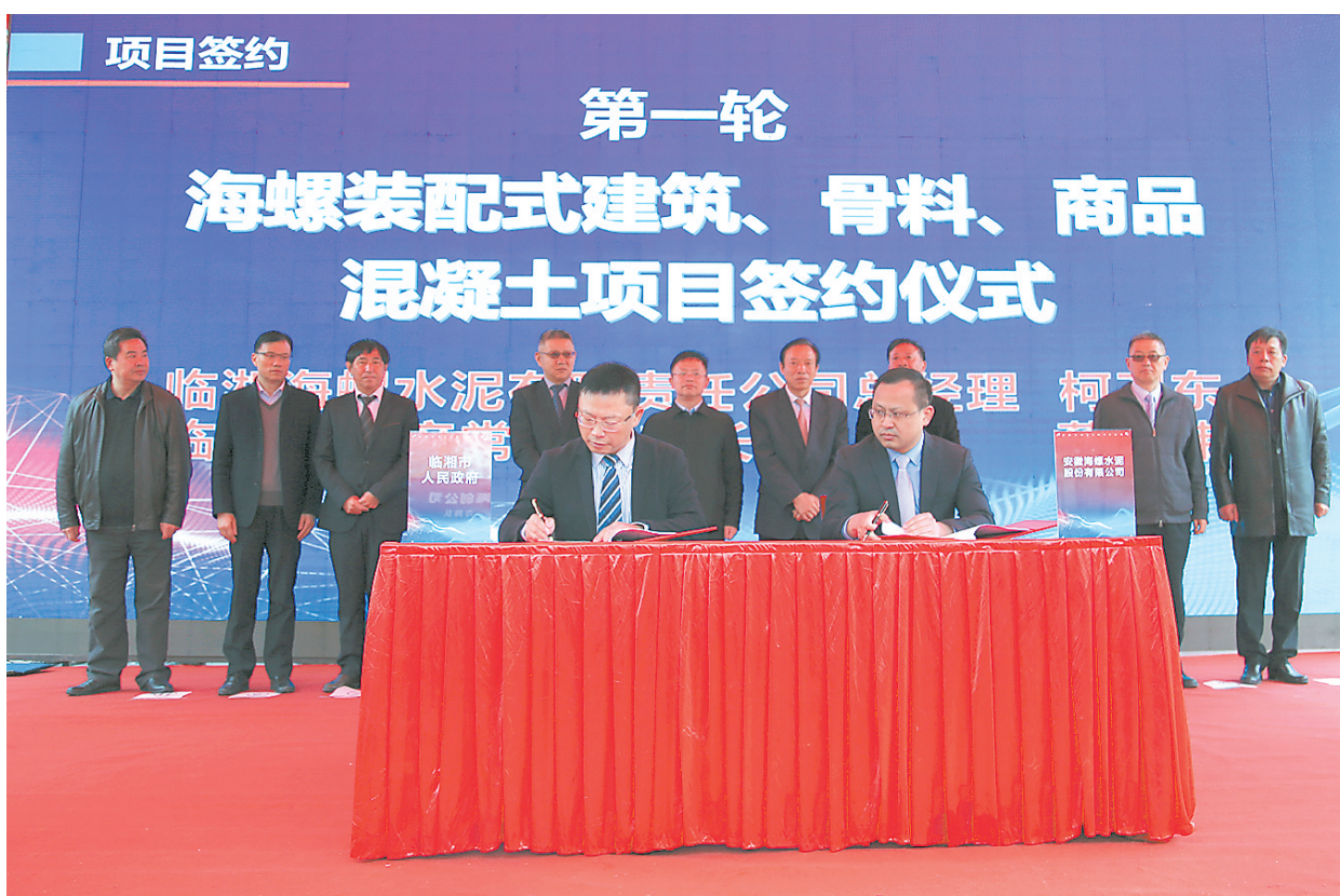
临湘举行今年第二批重大项目集中签约、开工仪式。