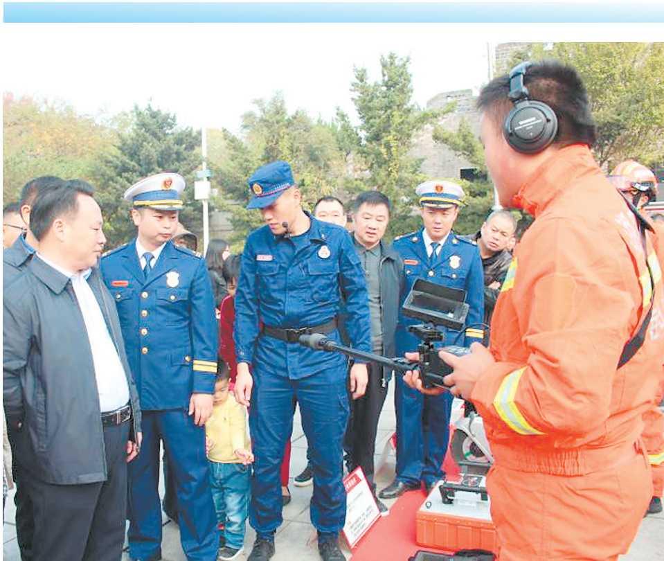
近日，以“防范火灾风险，建设美好家园”为主题的119消防宣传月活动启动仪式在岳阳市巴陵广场隆重举行。共计900余人参加了启动仪式。启动仪式后的消防宣传活动中，消防宣传人员在广场设立消防宣传服务站，向群众讲解基本消防常识及一般性家庭火灾的简单自救方法，同时发放了消防法律法规、初期火灾扑救等消防安全宣传资料。

接到投诉后，岳阳楼大队立即联系了市公交总公司，调查了相关情况。11月14日，公交司机乐某定被交警大队传唤并认定违法事实后，被处以罚款200元，驾驶证记3分的处罚。