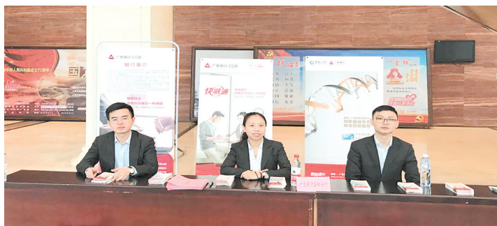
普惠金融知识宣传