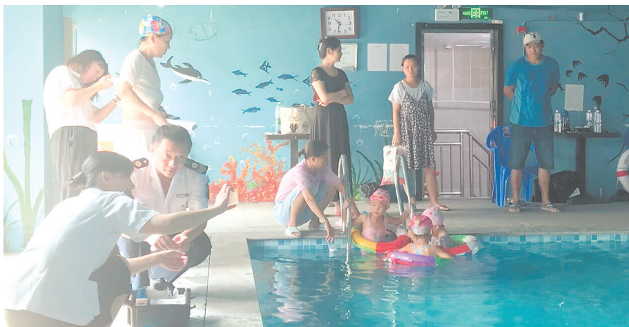
卫生监督人员对泳池进行检查

日前,执法人员对该单位整改情况再次进行了回访,并使用水质快速检测仪对泳池水质进行现场检测,确保监督达到实效。同时,市卫计委监督执法局的工作人员也表示,这样的突击检查将常态化开展,对于市民反映度较高的游泳池还会进行不定期检查,如有不合格的情况,会当场进行处罚或责令整改。同时会规定整改期限,“如果市民在生活中发现有不规范经营、水质不合格等情况的泳池也可以向卫计委监督执法局进行举报。”