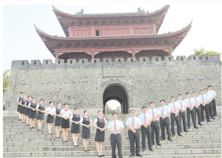
广发银行岳阳分行员工积极向上精神风貌