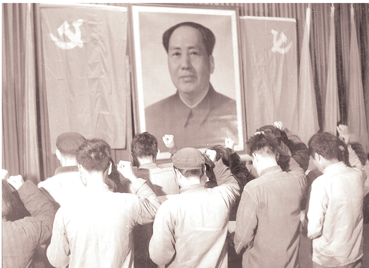
纸厂职工面向党旗和毛主席像表决心