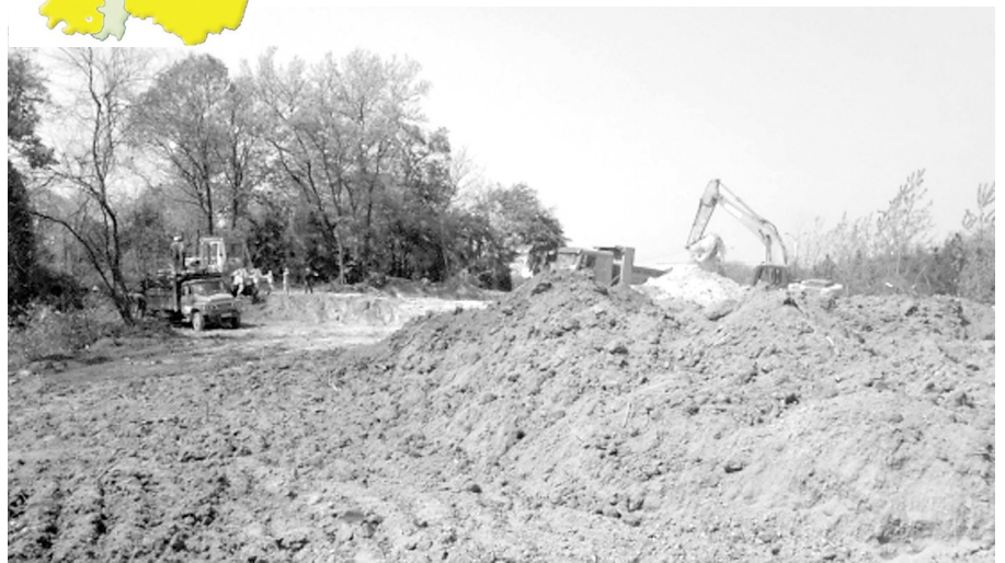
土壤治理修复现场

本报讯(记者 周小平)日前,岳阳市生态环境局临湘分局在临湘工业园滨江产业园组织召开临湘市原氨基化学品厂周边土壤治理修复工程推进工作会。项目承建单位、工程监理单位、环境监理单位、过程监测单位和过程审计单位相关负责人参加。