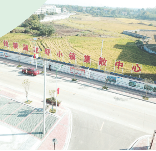
钱粮湖镇龙虾一条街成为美食地标性区域

“这段时间气温骤降,要注意护苗,如果结冰要破冰,水温低了要加水,为虾苗提供能量,保证虾苗的成活率。”春节期间,君山区采桑湖龙虾专业合作社负责人肖海书正在利用农闲时间上门入户为钱粮湖镇虾农“传经送宝”。