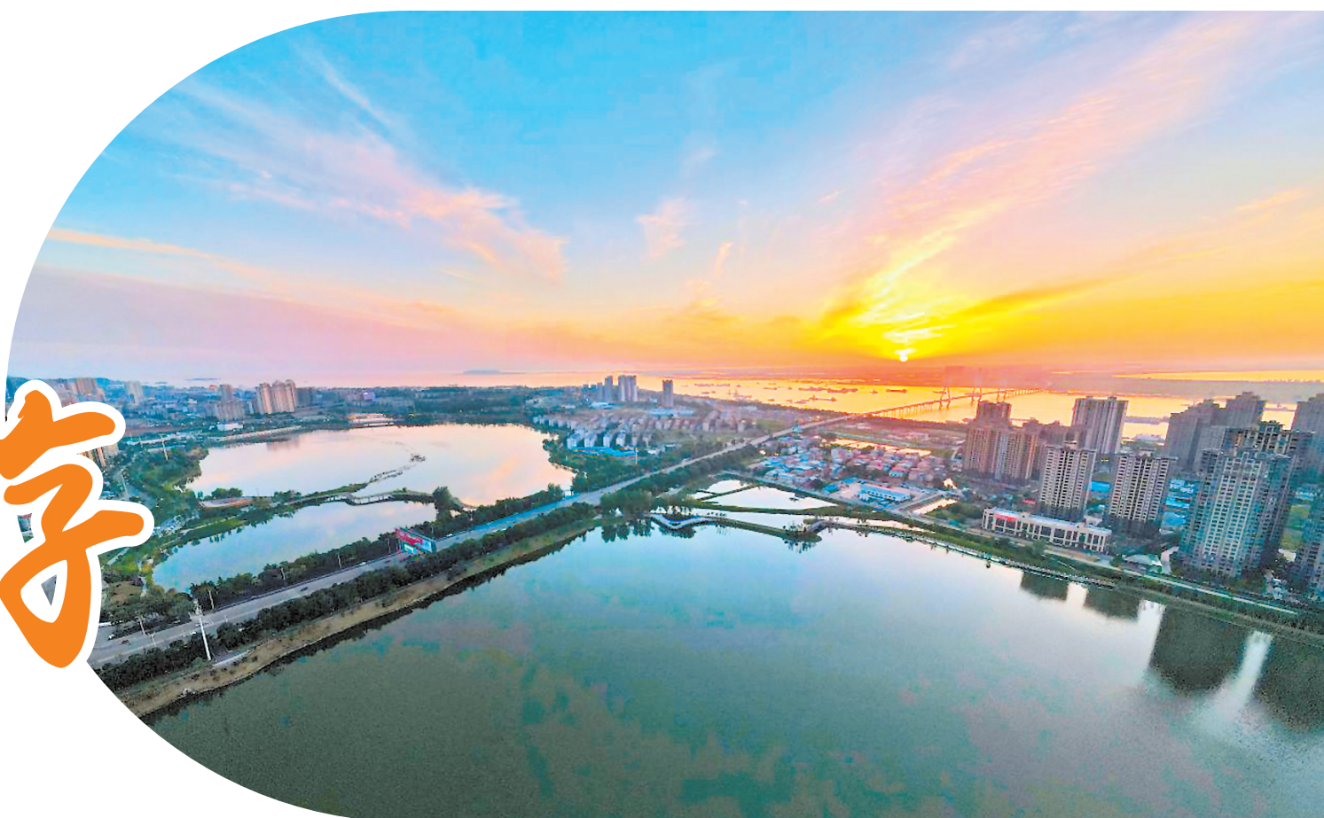
东风湖畔“梦里水乡”。