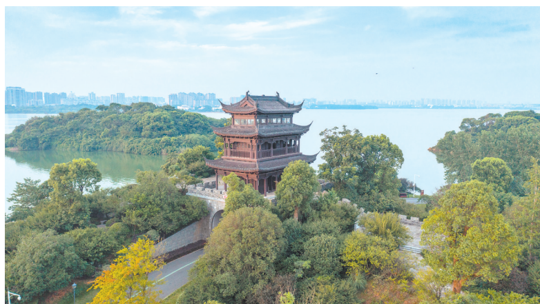
环南湖三圈南段赏梅阁。