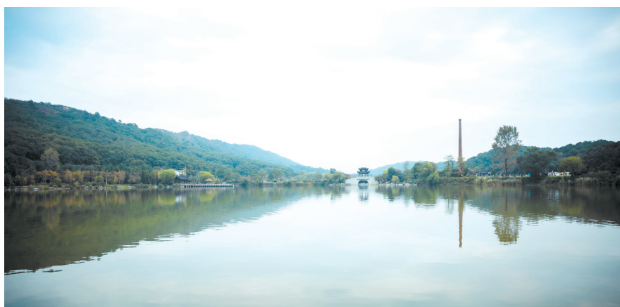
赏心悦目三道湾。