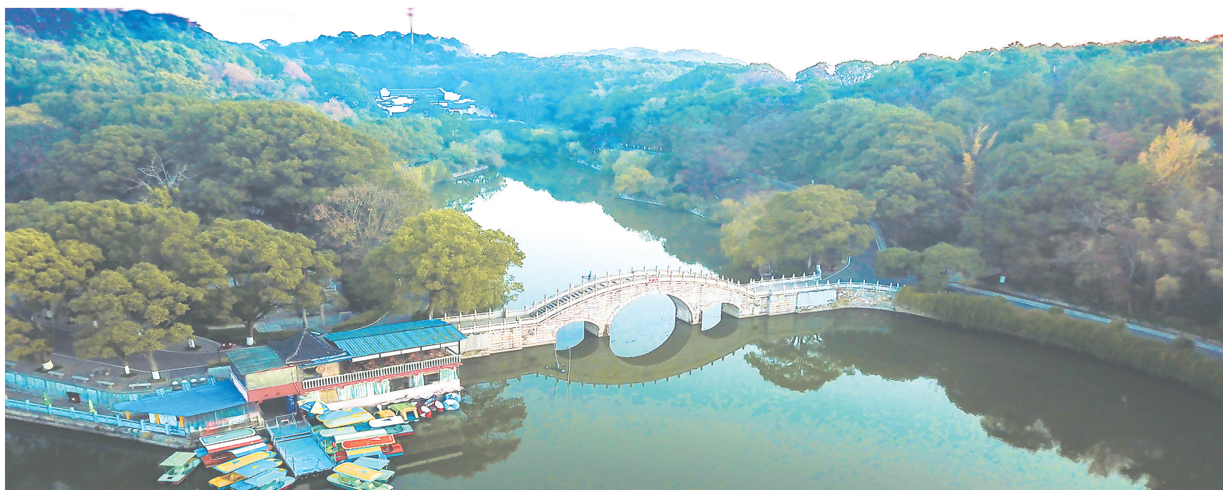
满目翠绿君山岛。