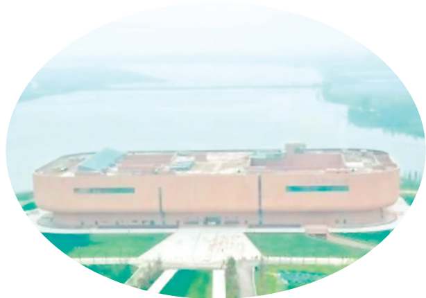
洞庭湖博物馆。(资料图片)