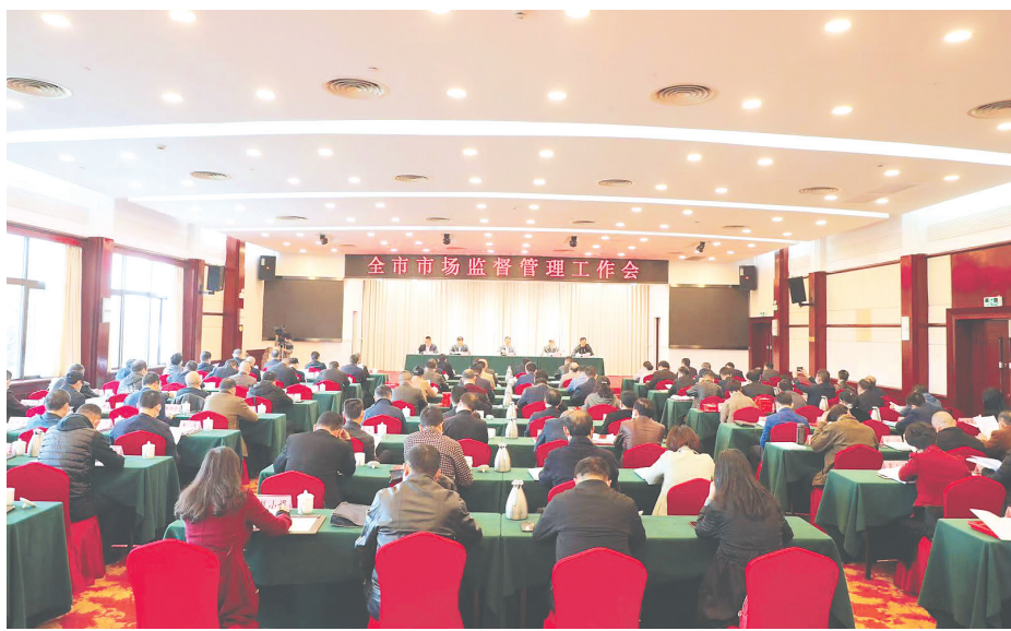
全市知识产权工作会议会场全景。

权保护工作。作为市场监管部门，我们充分发挥市场监管优势和服务企业职能，全面加强知识产权保护和运用，最大限度释放创新创造活力，有力支撑了全市经济社会高质量发展。进一步创新监管举措，优化保护水平：一是构建大保护工作格局。完善多元化纠纷解决机制。培育和发展仲裁机构、调解组织和公证机构，鼓励行业协会、商会建立知识产权保护自律和信息沟通机制，引导行业企业严格执行行业规范，支持行业协会、仲裁机构等开展知识产权纠纷调解、仲裁等工作。加强市县和部门间知识产权执法协作，强化知识产权保护和信息沟通机制，加快形成协调、顺畅、高效的知识产权大保护工作合力。二是加大监管执法力度。加强专利、商