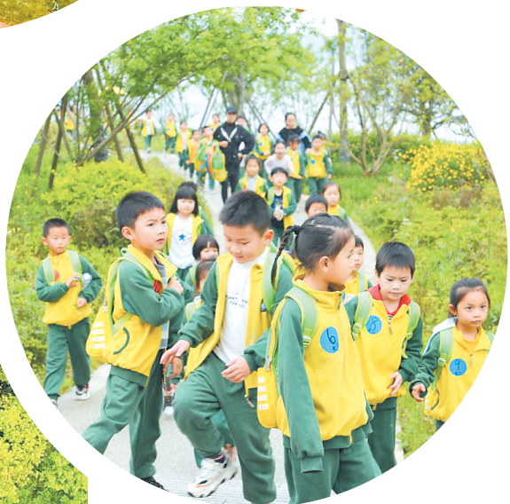
▲春游踏青、嬉戏玩耍,童年的美好回忆在东风湖生态公园内定格。