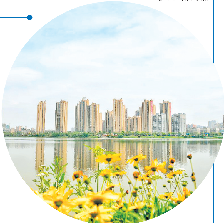
▲湖水清冽荡漾、岸坡绿草青青。东风湖重现生机,蜕变新生。