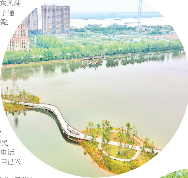
▲如今,东风湖全域实行人放天养,曾经的鱼塘已经成为岳阳新晋网红打卡地。