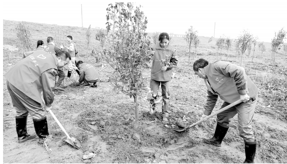
开展义务植树活动。

这是该公司连续第4年在长江干堤开展义务植树活动,累计植树近2500棵。3月初以来,巴陵石化公司广大员工及家属迅速行动起来,通过造林绿化、抚育管护、认种认养、捐资捐物、志愿服务等8种形式参与义务植树活动。在本次义务植树活动中,来自该公司机关、行政事务中心以及各单位的团员青年等志愿者,身穿红马甲,在三个片区分散植树,一派热火朝天景象,共栽种红叶石楠、桂花、紫薇等树木460多棵。