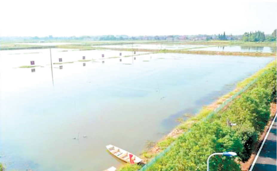
湘阴县鹤龙湖镇新河村蟹虾混养模式。资料图片

适度发展、提质增效、精准发力……这是我市农业农村局打出的一套小龙虾产业高质量发展的组合拳。 稻田养虾不仅能提高稻米品质,还能实现“一田双收”,有力有效帮助农户脱贫致富奔小康。2013年开始,我市小龙虾养殖面积呈逐年递增趋势,至2020年全市小龙虾养殖面积105.27万亩,其中稻田养虾面积94.1万亩。 适度发展。全市稻田养虾已达到一定规模,增加种植面积受到局限。一是稻田选择有要求。稻田养虾模式需要选择水源充足、