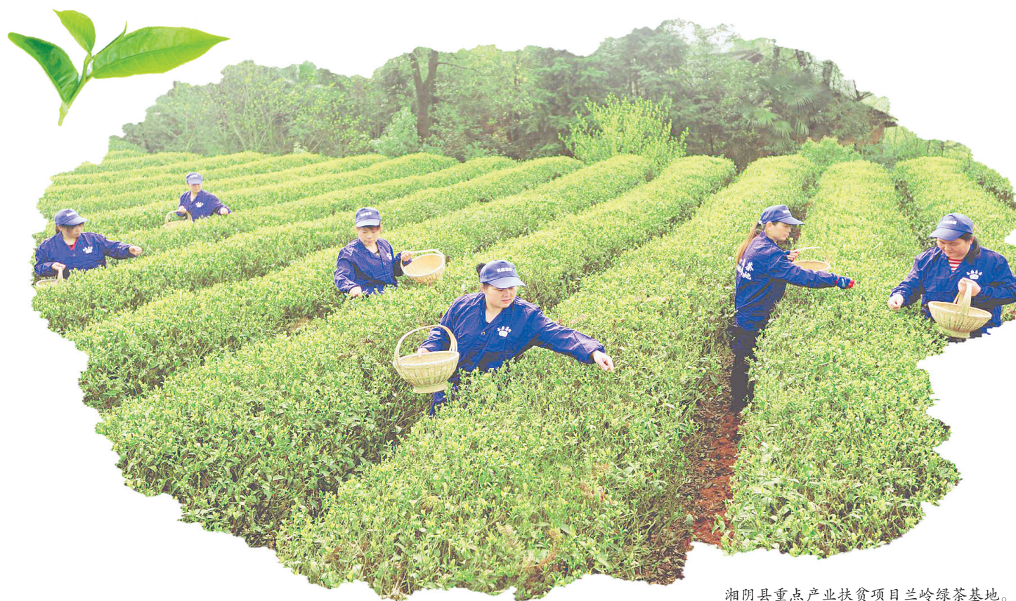
湘阴县重点产业扶贫项目兰岭绿茶基地。

本报讯 昨日,记者从市茶产业办获悉,为深入贯彻落实中央一号文件和中央、省、市三农工作会议精神,市茶产业办结合我市农业发展的新定位、新目标、新任务和新使命,全面发力品牌建设、营销体系、生产体系、产业体系,奋力打造全省现代茶产业创新发展先行区,力争2021年实现茶叶总产值60亿元。