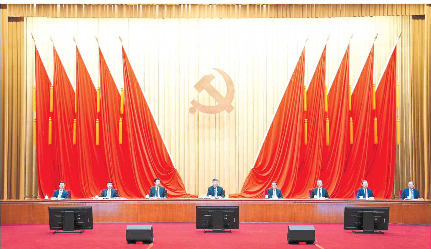
2月20日,党史学习教育动员大会在北京召开。中共中央总书记、国家主席、中央军委主席习近平出席会议并发表重要讲话。

新华社北京2月20日电 党史学习教育动员大会20日上午在北京召开。中共中央总书记、国家主席、中央军委主席习近平出席会议并发表重要讲话。他强调,在全党开展党史学习教育,是党中央立足党的百年历史新起点、统筹中华民族伟大复兴战略全局和世界百年未有之大变局、为动员全党全国满怀信心投身全面建设社会主义现代化国家而作出的重大决策。全党同志要做到学史明理、学史增信、学史崇德、学史力行,学党史、悟思想、办实事、开新局,以昂扬姿态奋力开启全面建设社会主义现代化国家新征程,以优异成绩迎接建党一百周年。