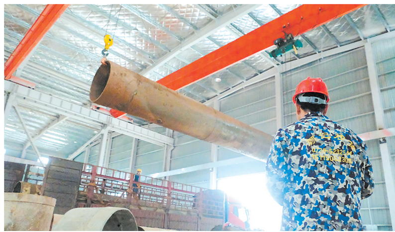
体兴工程机械公司专业制造交通基础打桩用钢护筒。

本报讯(记者 彭扬飞 通讯员 张为任 李亚)1月21日，在湖南体兴工程机械有限公司的厂房内，工人们正忙着对回收的钢护筒进行维修保养。这家从神鼎山镇沙溪走出来的本土工程机械公司，自2020年在飞地园区兴建1万平方米厂房以来，目前已经实际投资超过6000万元，试投产2个多月，产品成功销售到中铁、中建等知名建筑企业。