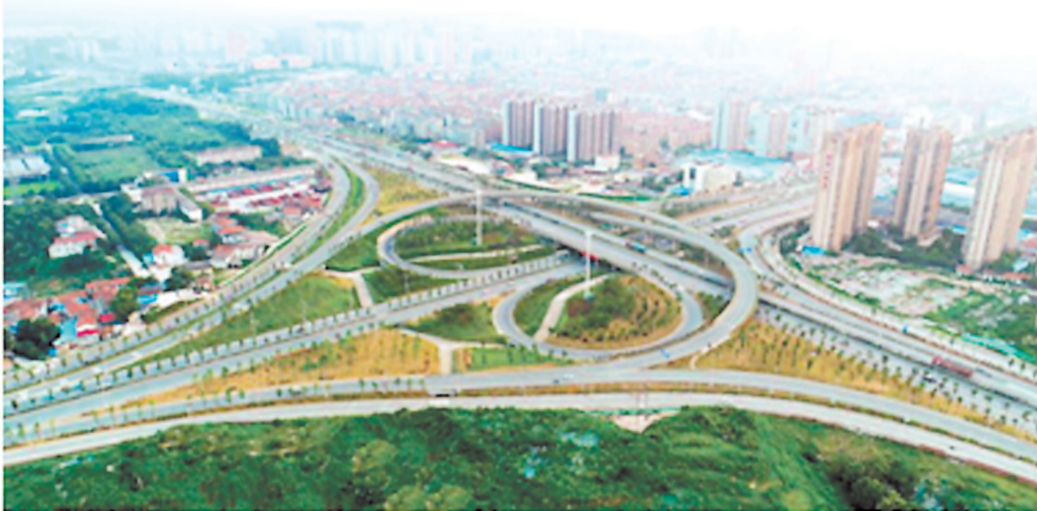
经开区着力促进生态宜居,推动乡村振兴。

做好农村人居环境整治工作。大力推行垃圾分类。继续推行“户分类、村收集、乡转运、区处理”模式,实现乡镇垃圾中转设施“全覆盖”,加强综合整治,因地制宜建设一批垃圾站。把统一收集处理乡村医疗垃圾作为重点,加快推进农业生产废弃物资源化利用。继续做好控污治污工作。加快推动城镇污水管网向周边村庄延伸覆盖,推广“厕所革命管散户、生态湿地管屋场、集中处理管城镇”模式,严控污水乱排乱放,突出抓好农村饮用水源达标整治。继续提升村容村貌。因地制宜、量力而行,加快补齐入户道路、给排水、电力、通信等农村基础设施建设短板。继续绿化美化亮化乡村主路,逐步实现道路林荫化、庭院花果