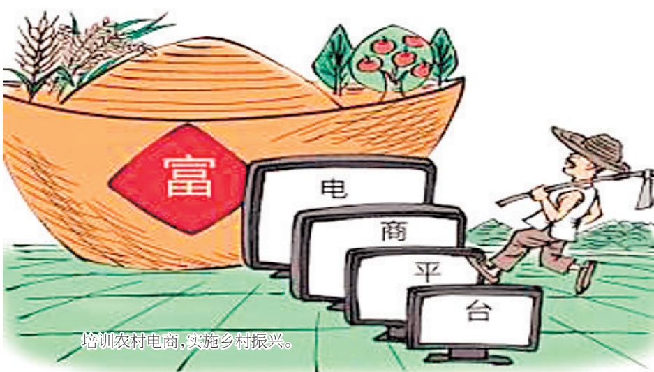
培训农村电商，实施乡村振兴。

龙头怎么甩，龙尾怎么摆。基层党员干部，尤其是党组织“一把手”，要发挥“头雁”作用融入乡村振兴，把握乡村振兴的时代脉搏，答好乡村振兴的时代考题，激发乡村振兴的内在动力，形成“头雁领航、群雁齐飞”的雁阵效应，让全面脱贫与乡村振兴有效衔接“动力满格”。