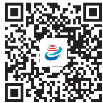
扫码下载“楼区融媒”APP 关注更多资讯