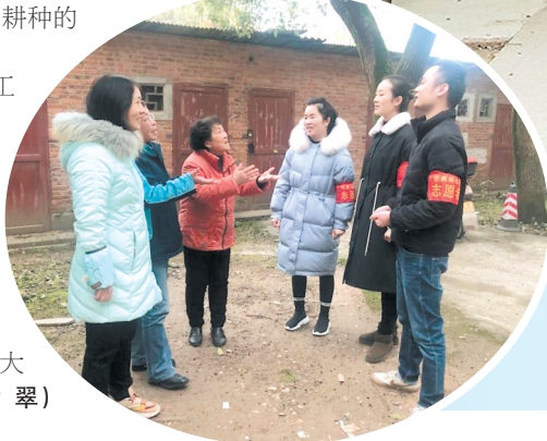
▲工作人员进社区解难题。